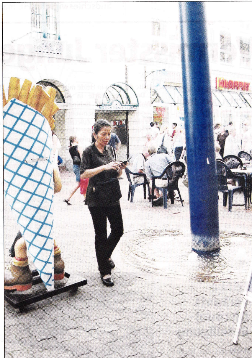
Das Wasserbecken am blauen Zauberstab vor der Holmpassage verschwand mit dem Umbau der Fußgängerzone.

cher Clemens Teschendorf an, dass den Vorwürfen des Künstler nachgegangen werde. Angesichts der Weihnachtszeit und des bevorstehenden Jahreswechsels könne mit einer Stellungnahme